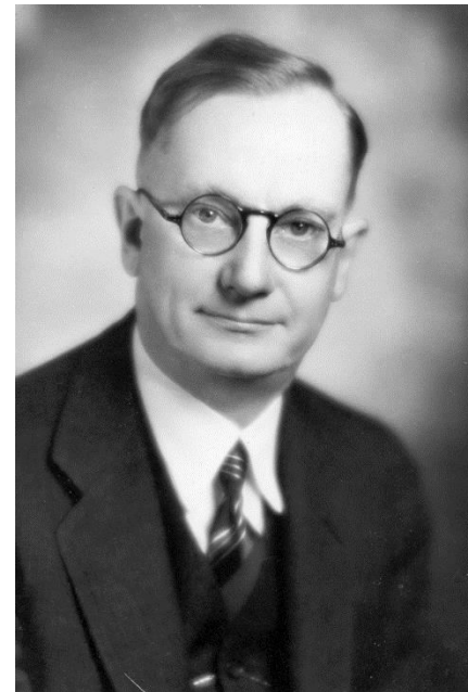
Emory Bogardus (1882-1973)